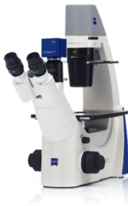
Primovert + Educam 105