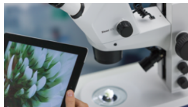
各種タブレット端末・スマートフォンから制御が可能