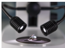
サンプル作成に最適なダブルアーム照明