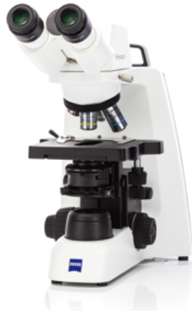
Primostar 3 (双眼)