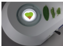
明・暗視野の切替え可能な透過照明