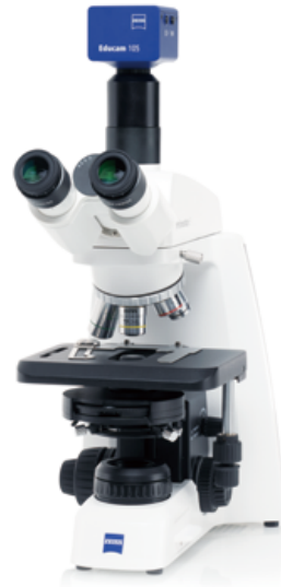
Primostar 3 + Educam 105