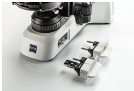
ハロゲン電球または省エネの3W LED照明のいずれかを使用して、安定した色温度や光量を提供します