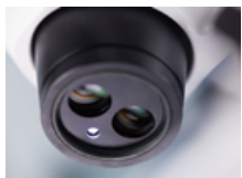
本体内蔵同軸照明