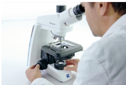
余分なアクセサリボックスやケーブルは一切不要