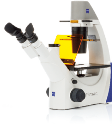
Primovert iLED 蛍光