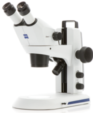
Stemi 305 (双眼)EDU

Wi-Fiカメラ内蔵実体顕微鏡 Stemi 305 camはカメラがリニューアルされ新発売しました。