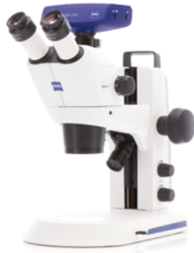
Stemi 305 (三眼)EDU ※三眼セットにはデジタルカメラは含まれません。