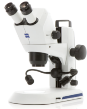
Stemi 305 cam