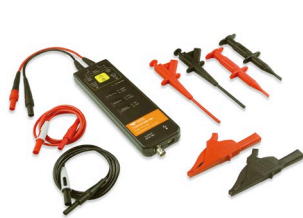
T3HVD1500-200 高電圧差動プローブ

*ソフトウェアはオプションカードにて納品されます。実装には登録手続きが必要となります。