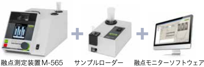
融点測定装置 M-565 サンプルローダー 融点モニターソフトウェア