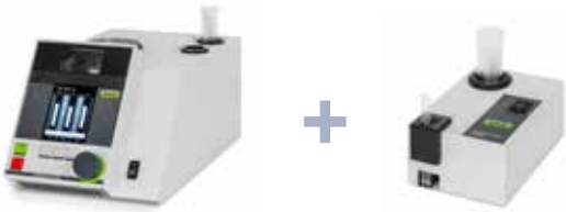
融点測定装置 M-565 サンプルローダー