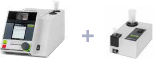
融点測定装置 M-560 サンプルローダー