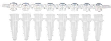
8 連ストリップチューブ