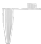
シングルチューブ