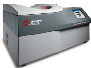
卓上型超遠心機 Optima MAX-XP/TL シリーズ