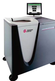
フロア型超遠心機 Optima XPN /XE シリーズ