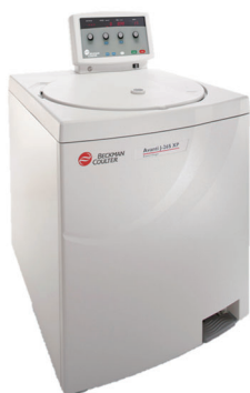
高速冷却遠心機 Avanti シリーズ

特典② 再訪問を要する場合には、その出張料金が 半額 (離島地域および沖縄は除きます)