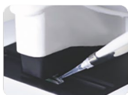
① サンプルをロード