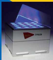
SynLED Parallel Photoreactor (Z742680-1EA)

均一照射により光レドックス触媒反応の再現性を高めた、スクリーニング可能でコンパクトな装置