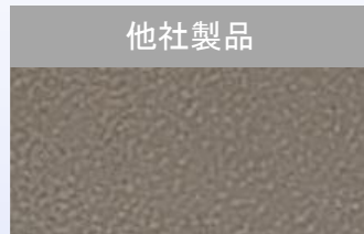
培養面の顕微鏡写真 ×100