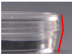
35mm・60mmディッシュ側面

容器の直径が小さく持ちにくい35mm・60mmディッシュも、直径が大きく蓋を掴みにくい150mmディッシュも、IWAKI品は取り扱いやすい形状に工夫されています。