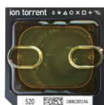
Ion 520™ Chip 400 - 600万リード 1 Gb