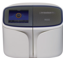
Ion GeneStudio S5 システム ターンアラウンドタイム:19時間*