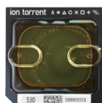
Ion 530™ Chip 1,500 - 2,000万リード 4 Gb