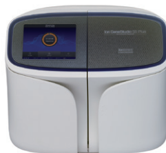
Ion GeneStudio S5 Plus システム ターンアラウンドタイム:10時間*