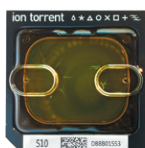
Ion 510™ Chip 200 - 300万リード 500 Mb