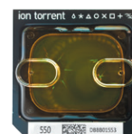
Ion 550™ Chip 1 - 1.3億リード 25 Gb