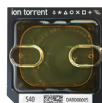
Ion 540™ Chip 6,000 - 8,000万リード 15 Gb