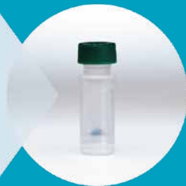
フィルトレーション完了 そのまま HPLC や LC-MS へ